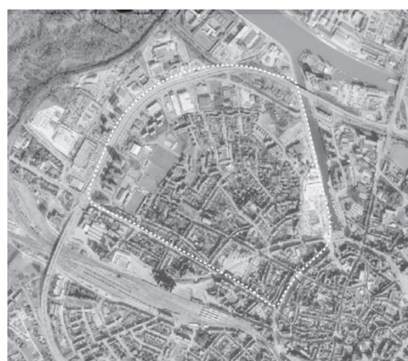
Zoom Heilig-Hartwijk morfologische opbouw.

De wijk zelf heeft een heterogene morfologische opbouw. Tot de jaren '70-'80 was voor het oostelijk gedeelte bebouwd, als een uitloper van de historische stadskern, met rijwoningen maar ook vrijstaande villa's. Hierna is de wijk systematisch verder verkaveld, met gesloten bebouwing, appartementen en vrijstaande woningen. In het westen, aan de grote ring ligt een KMO-zone met een provinciaal sportcentrum. In het oosten maakt de industriële ontwikkeling aan de Kanaalkom gradueel plaats voor de nieuwe 'Blauwe Boulevard'.