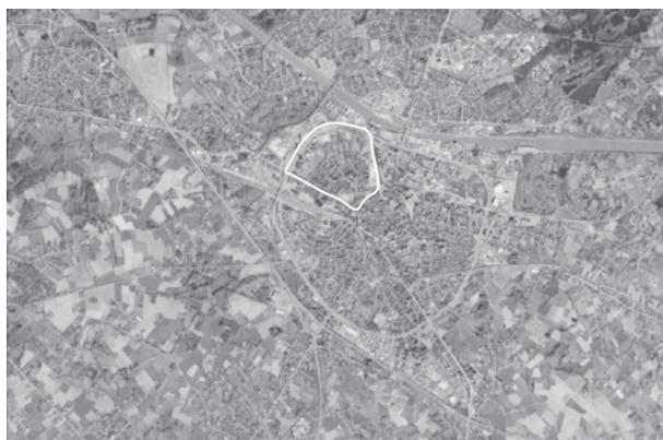
Ligging Heilig-Hartwijk t.o.v. het stadscentrum van Hasselt.

De Heilig-Hartwijk is gelegen ten westen van het historisch stadscentrum van Hasselt. De wijk is gelegen tussen de grote en de kleine ring, tussen het Albert Kanaal en de spoorwegbundel van het station. Ten zuiden wordt de wijk begrensd door de Kuringersteenweg / Koningin Astridlaan, een van de vier historische handelsroutes die samenkomen in het centrum van Hasselt. Er wonen 6158 mensen en de dichtheid is 26,31 inwoners/ha.